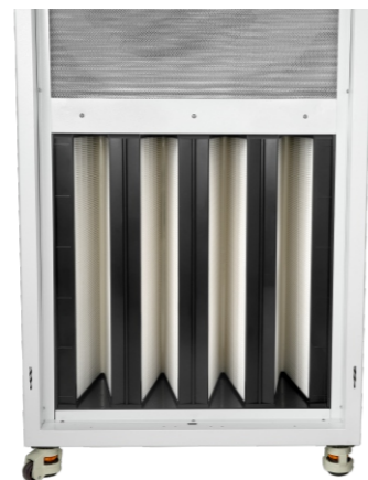
万向轮和高效过滤网