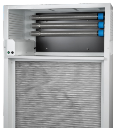
等离子管和初效过滤网